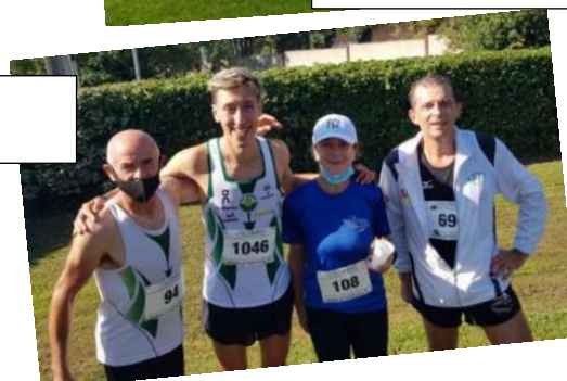
Fin d'Oisienne (13/09/2020)