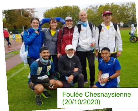
Foulée Chesnaysienne (20/10/2020)