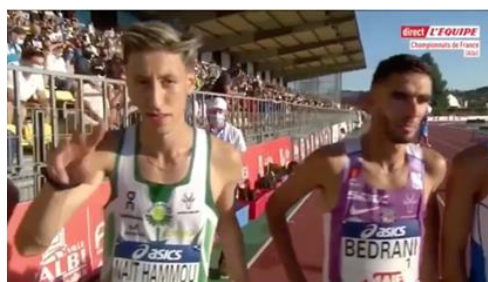
Championnat de France Albi 3000m steeple (12/09/2020)